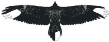
in den Alpen freigelassener Bartgeier

Den freigelassenen Bartgeiern werden zur Identifikation einzelne Federn im Flügel - und/oder Schwanzgefieder weiß gebleicht. Diese Markierungen bleiben bis zur ersten Vollmauser im Alter von 2-3 Jahren erhalten.