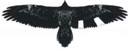
in den Alpen freigelassener Bartgeier .

Den freigelassenen Bartgeiern werden zur Identifikation einzelne Federn im Flügel - und/oder Schwanzgefieder weiß gebleicht. Diese Markierungen bleiben bis zur ersten Vollmauser im Alter von 2-3 Jahren erhalten.